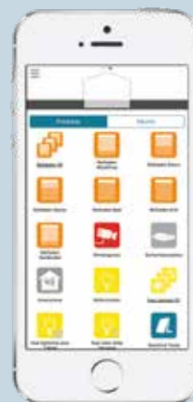
Das vernetzte Zuhause ist immer dabei: daheim und unterwegs, mit Smartphone, Tablet und PC.