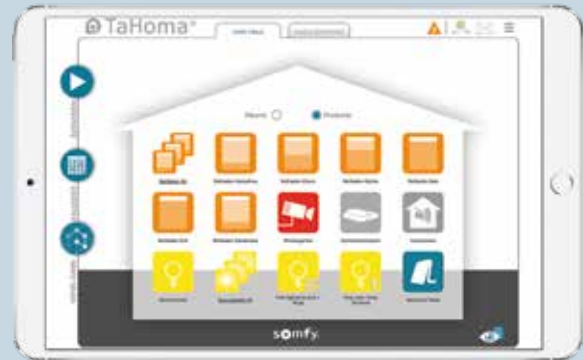
Ein leicht verständliches und interaktives Menü.

Steuern Sie alles mit einem System. Mit TaHoma® erhalten Sie eine leistungsstarke Hauszentrale, ohne dass Sie dafür ein kostspieliges Steuerungsdisplay benötigen. Sie bedienen die komplette Technik ganz einfach über die grafische Oberfläche – per Smartphone, Tablet oder PC.